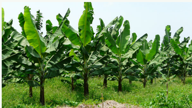
Plantation Bio

Cette filière est labellisée bio & équitable selon la certification Biopartenaire® depuis 2019. « Nous avons ainsi pu verser un fonds de développement de 6000$ sur la saison 2021 ». Pour les ouvriers, les bénéfices sont multiples :